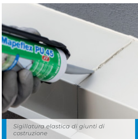
Sigillatura elastica di giunti di costruzione