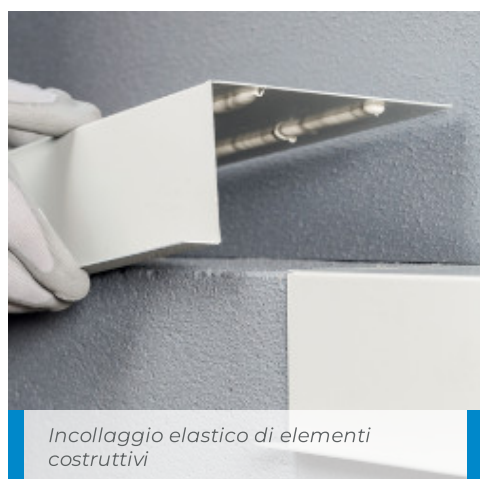
Incollaggio elastico di elementi costruttivi