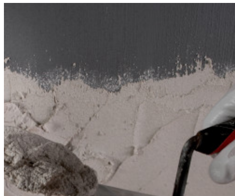
Applicazione di intonaco su Eco Prim Grip Plus