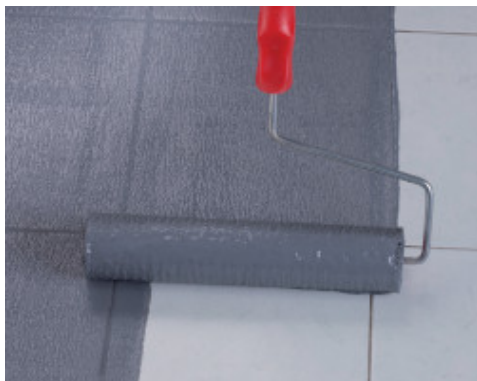
Applicazione a rullo di Eco Prim Grip Plus su pavimento preesistente in piastrelle di gres porcellanato