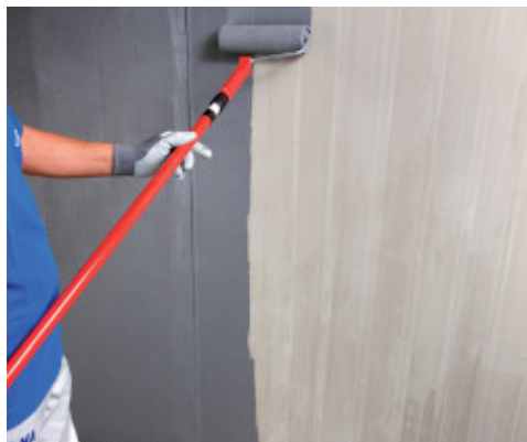
Applicazione di Eco Prim Grip Plus a rullo su supporto in calcestruzzo

Qualora sia utilizzato come promotore di adesione per lisciature cementizie su supporti trattati con primer epossidici o poliuretanici (come Primer MF , Primer MF EC Plus , Eco Prim PU 1K Turbo ) sui quali non sia stato effettuato lo spaglio di sabbia di quarzo, Eco Prim Grip Plus dovrà essere applicato puro dopo la completa asciugatura e non oltre 24 ore dall'applicazione dei suddetti primer. Questo tipo di applicazione è ammessa nel caso di rasature non superiori ai 10 mm e qualora non sia prevista la posa di legno massiccio tradizionale.