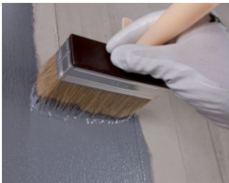
Applicazione di Eco Prim Grip Plus con pennellina su supporto in calcestruzzo